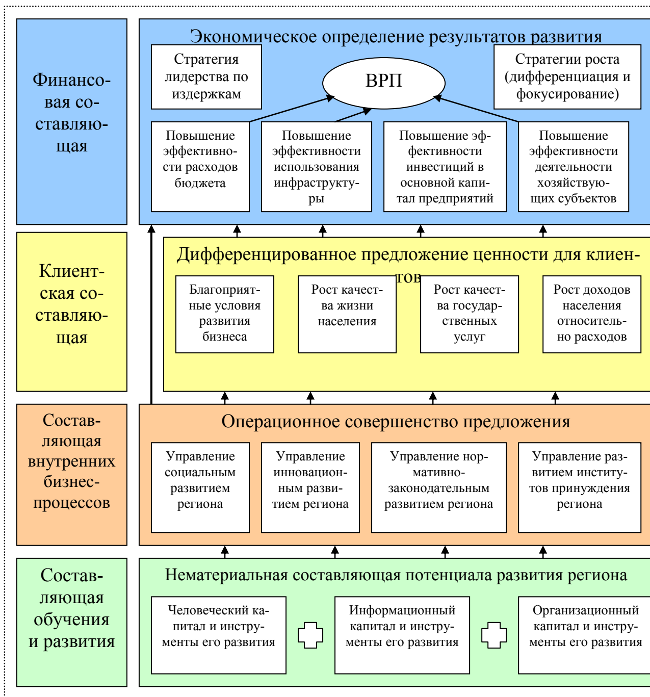
Рис. 2. Типовая стратегическая карта развития региона

Прогнозирование тенденций развития регионов Приволжского федерального округа было проведено с учетом необходимости внедрения предложенных в диссертационном исследовании методов и механизмов стратегического управления мезоуровневыми социально-экономическими системами, основанных на внедрении сбалансированной системы показателей в практику мезоуровневого менеджмента. Для целей прогнозирования были выбраны регионы с высокими (Самарская область (СО), Республика Татарстан) и низкими (Республика Марий Эл (РМЭ) и Республика Мордовия (РМ)) темпами социально-экономического развития. Прогнозирование про-